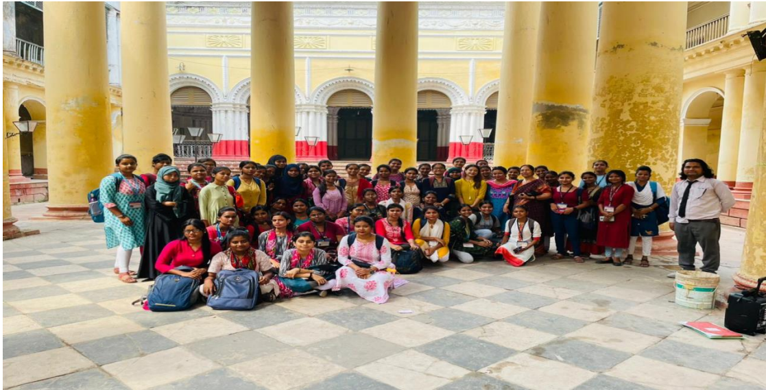
Picture of Serampore Rajbari, Hooghly on the event of World Heriatge day Celebration